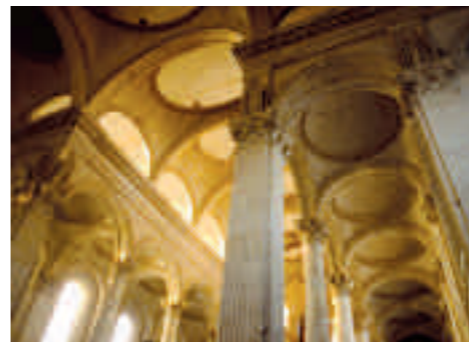
Les voûtes de la nef .

L'église occidentale associe une nef accostée de doubles bas-côtés, un transept saillant et un sanctuaire réduit à deux travées ouvrant par une grande arcade sur le dôme. La nef aligne une série de colonnes corinthiennes élancées, rehaussées d'arcs qui portent l'entablement. L'originalité de cette partie réside dans les fausses voûtes allégées d'oculi et de lunettes latérales qui laissent filtrer un éclairage indirect. Le vrai couvrement est assuré par une voûte en berceau qui repose, non pas sur les colonnades qui ne pouvaient en supporter la charge, mais sur les murs des premiers collatéraux.