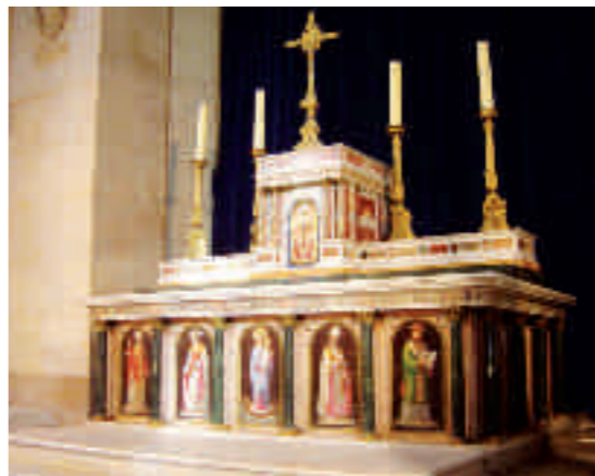
L'autel Torlonia offert par un prince italien en 1866.

La silhouette assez singulière de Notre-Dame et ses particularités architecturales sont le résultat des méthodes approximatives et empiriques d'un constructeur amateur. Il en est de même de la fragilité du monument ; la reconstruction des voûtes de la nef effondrées en 1921 s'accompagne d'une consolidation complète par une structure en béton armé (partiellement visible dans la crypte), permettant sans doute la sauvegarde du monument lors des bombardements de la Seconde Guerre mondiale.