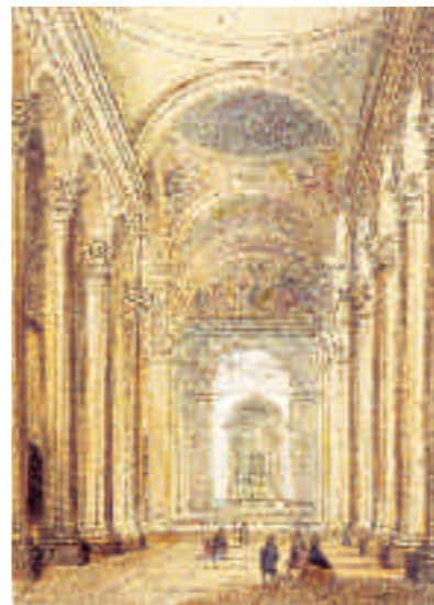
La nef de Notre-Dame. Lithographie anonyme, vers 1870. Bibliothèque municipale.

L'église occidentale associe une nef accostée de doubles bas-côtés, un transept saillant et un sanctuaire réduit à deux travées ouvrant par une grande arcade sur le dôme. La nef aligne une série de colonnes corinthiennes élancées, rehaussées d'arcs qui portent l'entablement. L'originalité de cette partie réside dans les fausses voûtes allégées d'oculi et de lunettes latérales qui laissent filtrer un éclairage indirect. Le vrai couvrement est assuré par une voûte en berceau qui repose, non pas sur les colonnades qui ne pouvaient en supporter la charge, mais sur les murs des premiers collatéraux.