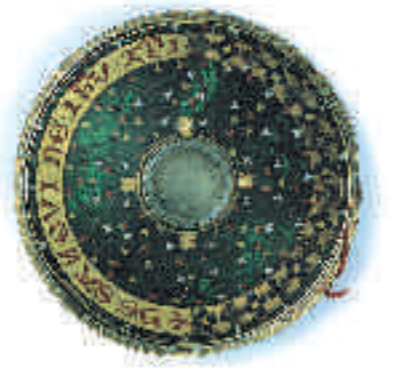
Le reliquaire du Saint-Sang.

Le trésor d'art sacré, ouvert en 1980 dans une galerie de la crypte, réunit une série de pièces appartenant aux églises de Boulogne et de la région : objets du culte, statues, tableaux, ex-voto, éléments de mobilier.