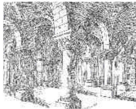
Reconstitution de la crypte romane par Camille Enlart.

Ses vestiges sont découverts au début du chantier et remontés dès 1839. C'est sans doute la construction, au 14 ème siècle, d'un chœur à déambulatoire et chapelles rayonnantes, mieux adapté au culte des reliques, qui en avait entraîné son abandon puis son comblement.