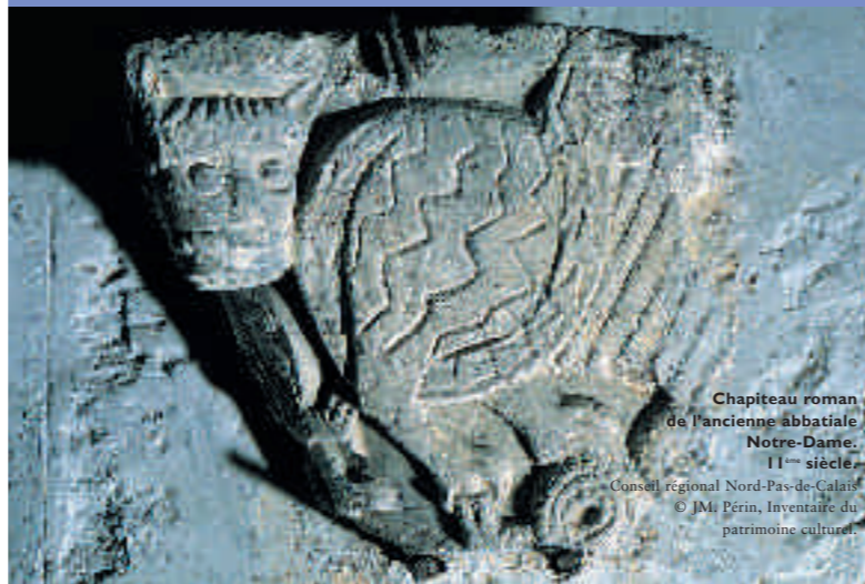
Chapiteau roman de l'ancienne abbatale Notre-Dame, 11 ème siècle.

Laissez-vous conter Boulogne-sur-Mer (français et anglais) Laissez-vous conter le château et les fortifications (français et anglais) Laissez-vous conter le beffroi et l'hôtel de ville (français et anglais) Laissez-vous conter l'église Saint-Nicolas (français et anglais) Laissez-vous conter le théâtre (français) Laissez-vous la reconstruction (français) Laissez-vous conter quelques personnages célèbres (français) Laissez-vous conter la Grande Rue (français) Laissez-vous conter le quartier de Bréquerecque (français) Laissez-vous conter la station balnéaire (français) Laissez-vous conter le cimetière de l'est (français) Laissez-vous conter le Chemin Vert (français)