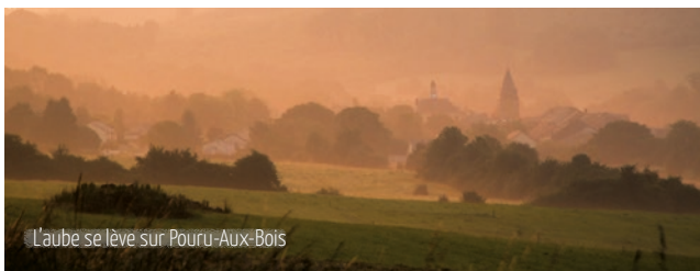
L'aube se lève sur Pouru-Aux-Bois