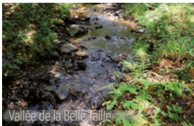
Vallée de la Belle-Taille