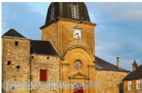
Église de Saint-Menges