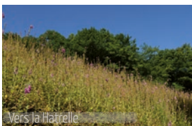
Vers la Hatrelle