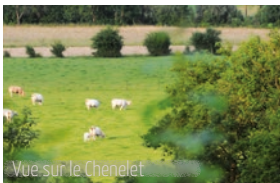
Vue sur le Chenelet