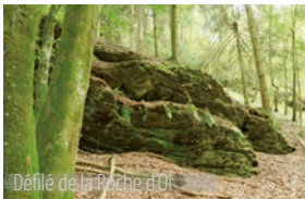
Défilé de la Roche d'Or