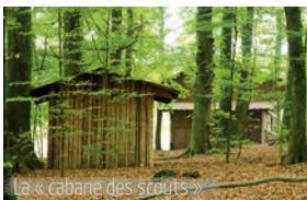
La « cabane des scouts »