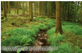
Ruisseau de la Grenouille